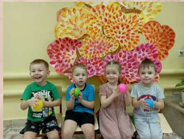
Работа с массажными мячами

Концентрация и управление вниманием. Языковая культура