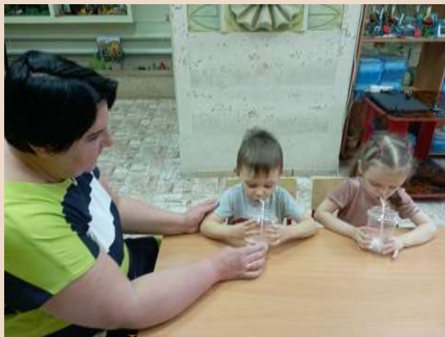
Формирование речевого дыхания