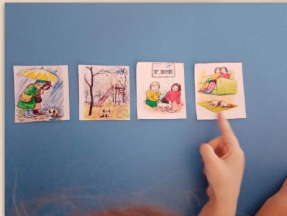
Д/и «Составь рассказ»