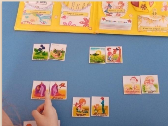
Д/и «Собери пословицу»