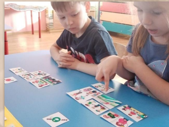
Д/и «Оцени поступок»»