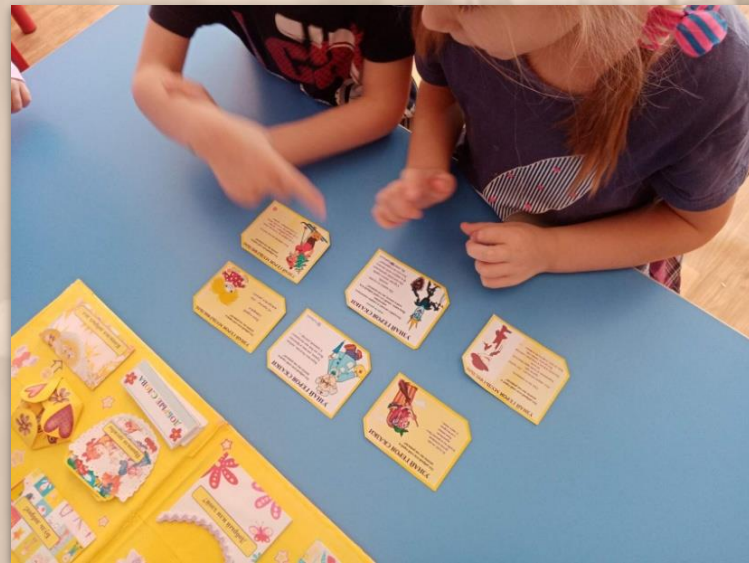
Д/и «Добрый - злой»