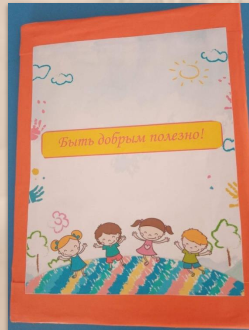
Лэпбук «Быть добрым полезно»