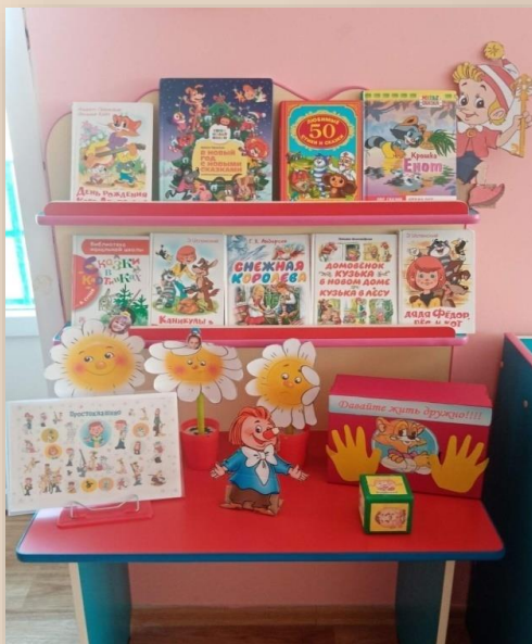
Книжный уголок, уголок настроения