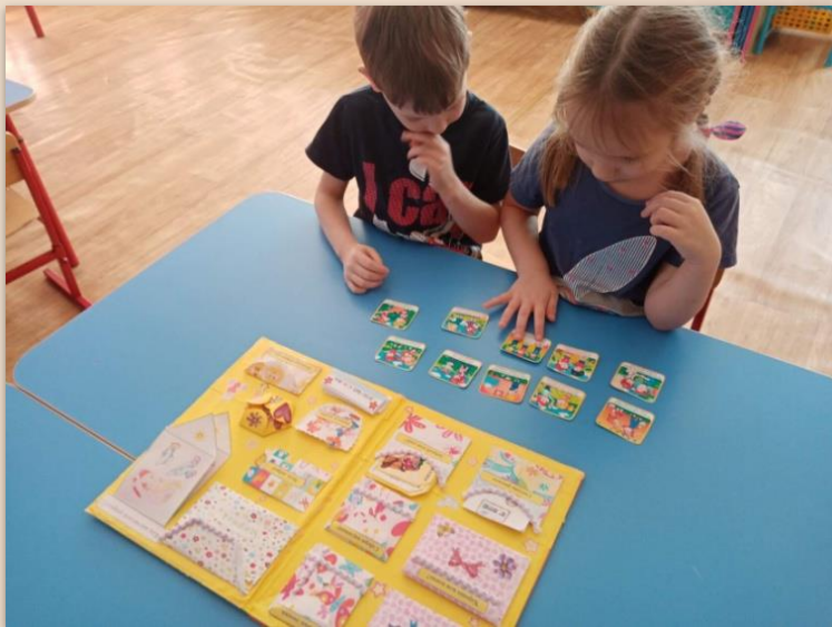
Д/и «Правила дружбы»